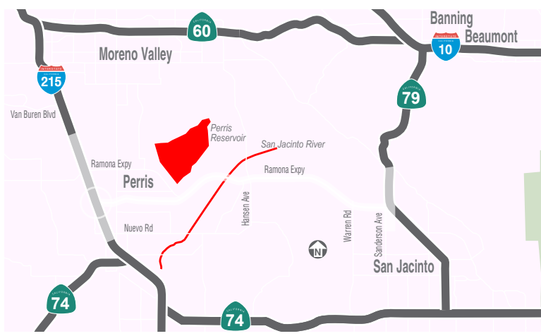
Límites del proyecto RCTC