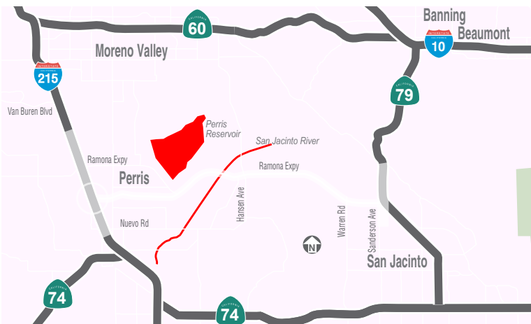
RCTC Project Limits