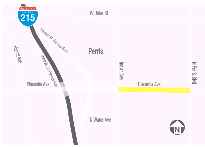
Límites del proyecto RCTC