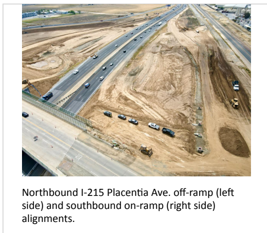
Northbound I-215 Placentia Ave. off-ramp (left side) and southbound on-ramp (right side) alignments.