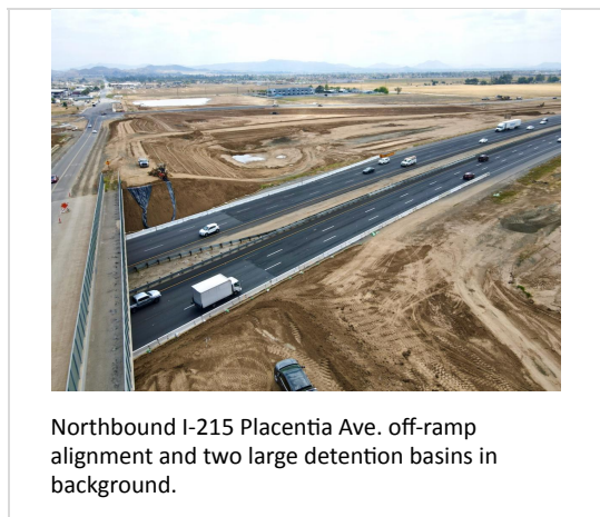
Northbound I-215 Placentia Ave. off-ramp alignment and two large detention basins in background.