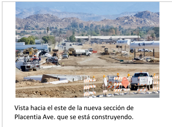
Vista hacia el este de la nueva sección de Placentia Ave. que se está construyendo.