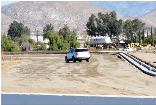
Crews have added curb and gutters along the new E. Frontage Rd. alignment.