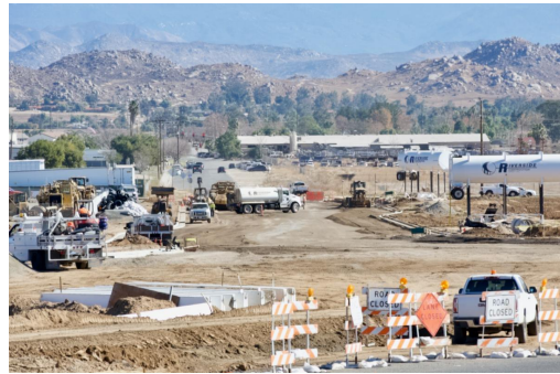
View of the new section of Placentia Ave. being built, facing east.