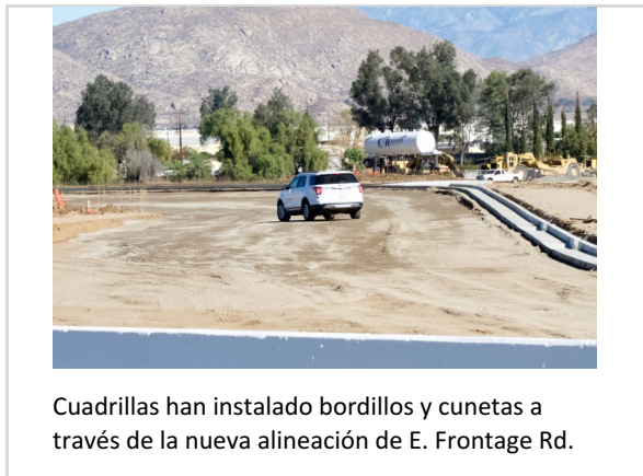
Cuadrillas han instalado bordillos y cunetas a través de la nueva alineación de E. Frontage Rd.